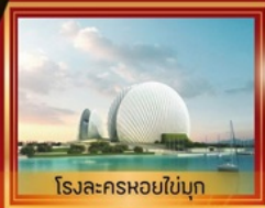
โรงละครหยอโข่มุ๊ก