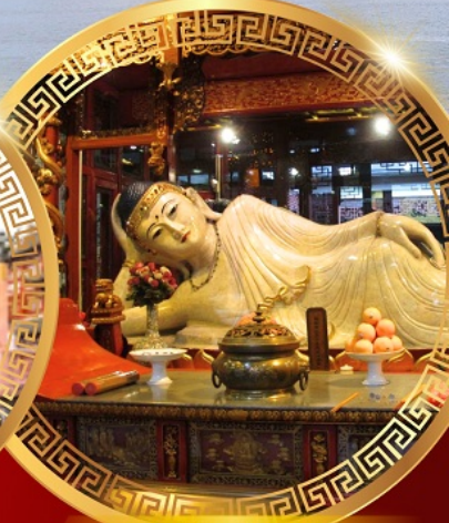
วัดพระหยกขาว