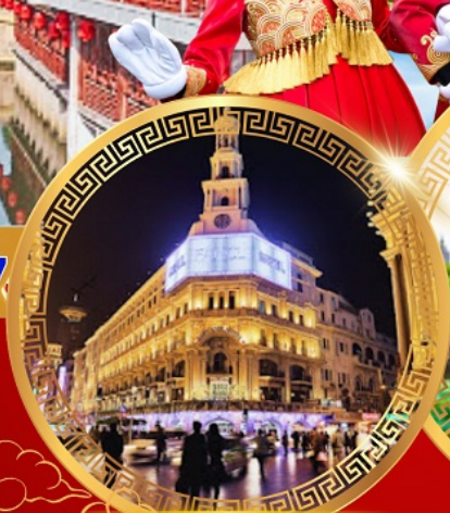
ถนนคนเดินหนานจิง

เดอะบรันด์ หาดไต้หวัน ขึ้นหอไข่มุก อิสระ เชียงใหม่ ดิสนีย์แลนด์ วัดหลงหัว อายุมากกว่า 1700 ปี สักการะวัดพระหยกขาว สวนอีหยวนกว่า 400 ปี สตาร์บัค ใหญ่ที่สุดในเอเชีย ช้อปปิ้งถนนโบราณชื่อดัง