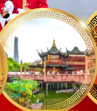
สวนอีหยวน