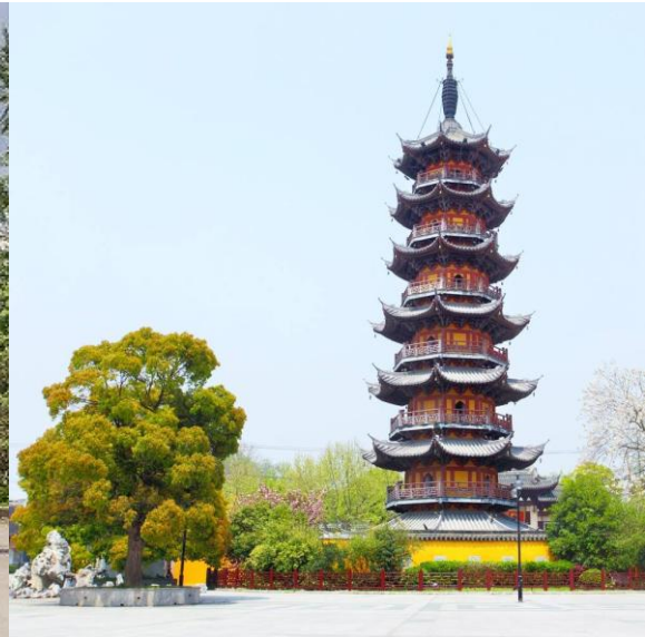
เจดีย์หลงหัว ซึ่งเป็นเจดีย์โบราณ 7 ชั้นสูง 40 เมตร

นำท่านถึง ถนนคนเดินหมู่บ้านโบราณซีเป่า ย้อนยุคไปกับหมู่บ้านน้ำชา ย้อนอดีตไปได้ถึงสมัยราชวงศ์ซ่ง แต่ช่วงที่ฟูฟ่าที่สุดเป็นสมัยราชวงศ์หมิง,ซิง ที่นี้นับเป็นเมืองอุตสาหกรรมทอผ้าฝ้ายใหญ่โต ซีเป่าวันนี้บรรยากาศเหมือนตลาดโบราณ มีของให้ช้อปกันเพลินๆ ตลอดทาง