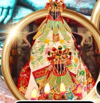
ยืมเงินเจ้าแม่กวนอิมสองห้า