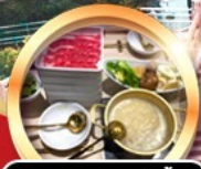
บุฟเฟ่ต์ชาบู เมย์โอบีอัน!!