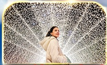
ชมงานประดับไฟนารานา โนะ ซาโตะ