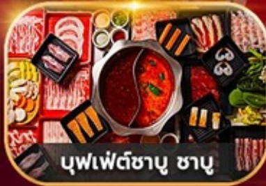
บุฟเฟ่ต์ซาบู ซาบู