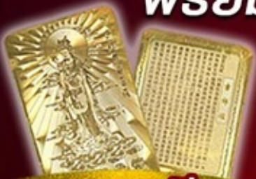
แถมฟรี แผ่นทองเจ้าแม่กวนอิม