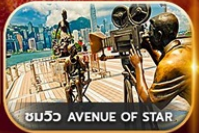
ชมวิว AVENUE OF STAR