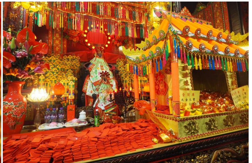
แถมฟรี แผ่นทองเจ้าแม่กวนอิม ประธานพรโชคลาภ เงินทอง