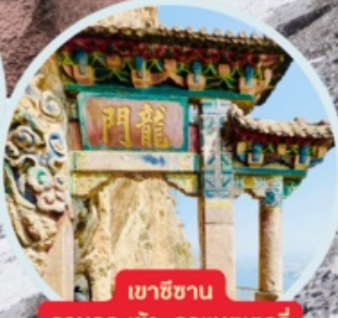
เขาสีซาน รวมกระเช้า+รถแบคเตอร์