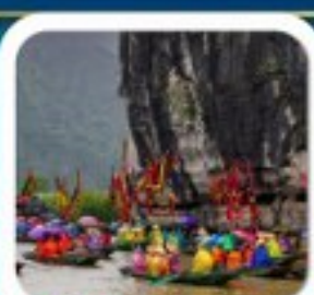
"ล่องเรืออ่างฮาน"