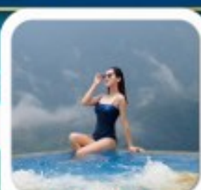
"พัก 4 ดาว PISTACHIO HOTEL"