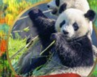
หิมะแพนด้ายักษ์เมืองเจียงหนาน