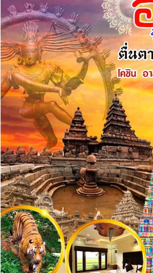
ล่องเรือซาฟารีเปรियาร์