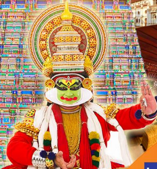
ชมการแสดงระบำคากาลิ