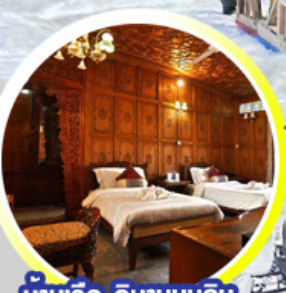
บ้านเรือ..วิมานบนดิน