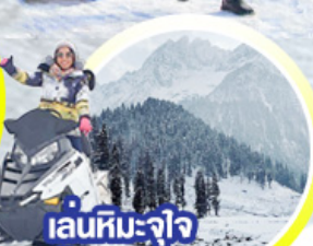
เล่นหิมะ-จิว ให้หายคิดถึง