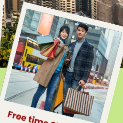
Free time Shopping