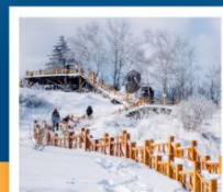
เขาเกาะหญ่า