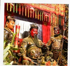
เทพเจ้ากวนอู วัดถุนไถ