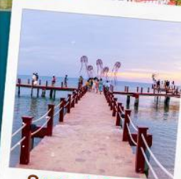
Sunset Sanato Beach Club