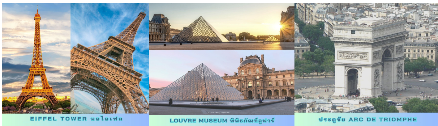
EIFFEL TOWER หอไอเฟล

นำท่าน ชมหอไอเฟล (EIFFEL TOWER) ซึ่งเป็นสัญลักษณ์ของกรุงปารีส เลิศหรู อลังการ โรแมนติก มหัศจรรย์ ด้วยความสูง 984 ฟุต สร้างด้วยโครงเหล็กทั้งหมด...ถนนชองเซลีเซ (CHAMPS-ELYSEES) ถนนที่มีต้นไม้เรียงรายทั้งสองข้างทางอย่างน่าเดินเล่น ต้นแบบถนนราชดำเนิน ปลัซเดอลา ค็องคอร์ด (PLACE DE LA CONCORDE) จตุรัสแห่งความสามัคคี โบสถ์แมดดิแลน ที่สร้างแบบกรีกโบราณ ถ่ายรูปกับปิระมิดหน้าพิพิธภัณฑ์ลูฟวร์ หรืออดีตพระราชวังลูฟวร์ จากนั้นนำท่าน ชมเมืองปารีส มหาราชินีแห่งเมืองหลวงของโลก ..ถ่ายรูปคู่กับประตูชัย (ARC DE TRIOMPHE) ของพระเจ้านโปเลียนอาร์ค เดอทร็อม ให้ท่านช้อปปิ้งสินค้าแบรนด์เนมที่มีชื่อเสียง ณ ห้างเกอล็อลาฟาแยส เช่น หลุยส์,