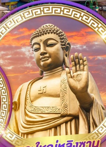
พระใหญ่หลิงซาน