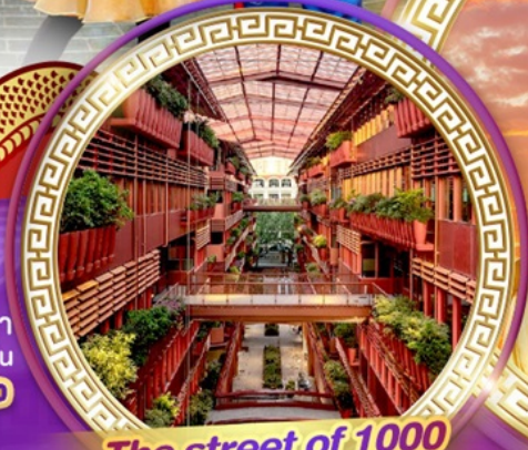
The street of 1000 red jars