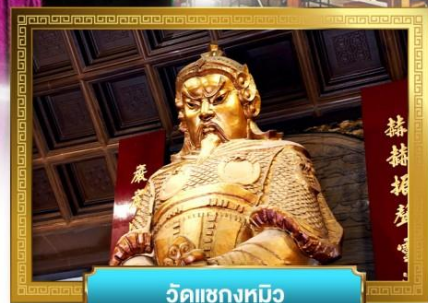
วัดเข่งทมิฬ