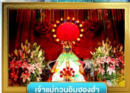
เจ้าแม่กวนอิมสองอำ