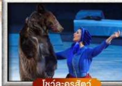
โชว์ละครสัตว์