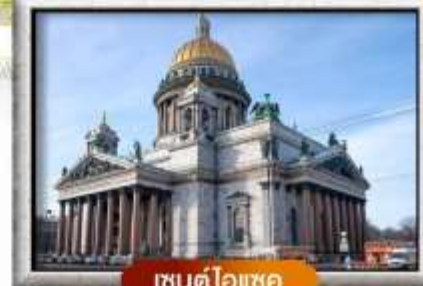
เซนต์ไอแซค