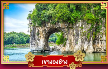
เขาวงช้าง

เที่ยวชมอุทยานซากุระหมีน้ำ "เซียนดินแดนแห่งขุนเขาและสาหร่ายน้ำ หมีน้ำ"