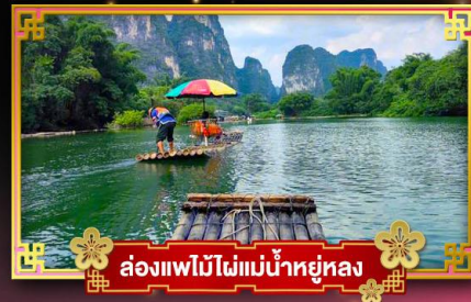
ล่องแพไม้ไผ่แม่น้ำหยูหลง