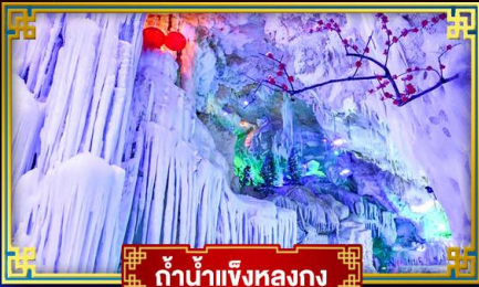
กำน้ำแข็งหลงกง

"เที่ยว 2 มณฑล กวางซี-ก๊วยโจว" สุดอลังการ น้ำตก 2 พรมแดน แหล่งท่องเที่ยวระดับ 5A