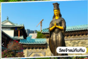
วัดเจ้าแม่กวนอิม