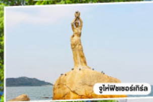
จูไห่พีซเซอร์กิส