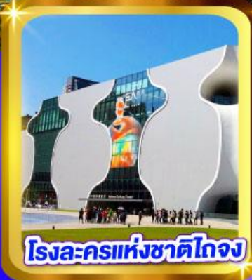
โรงละครแห่งชาติไทจง