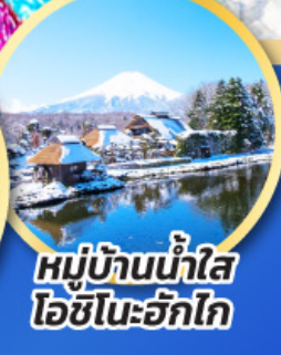
หมู่บ้านน้ำใส ไอชิโนะอึกิโกะ