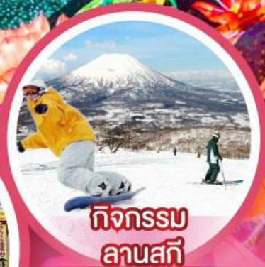
กิจกรรม ลานสกี