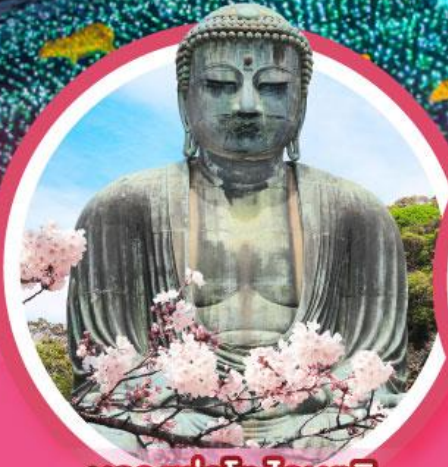
หลวงพ่อดโตโตบุตสึ