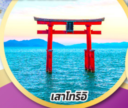
เสาโทริอิ