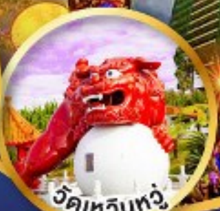
วัดเหวินทง