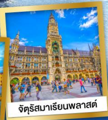
จัตุรัสมาเรียนพลาสต์

28 ธ.ค.67-05 ม.ค.68 95,900 12-20 ก.พ., 12-20 มี.ค.68 89,900