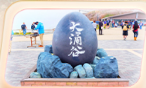
ชุมชนไร่ดำโอวาคุดานิ