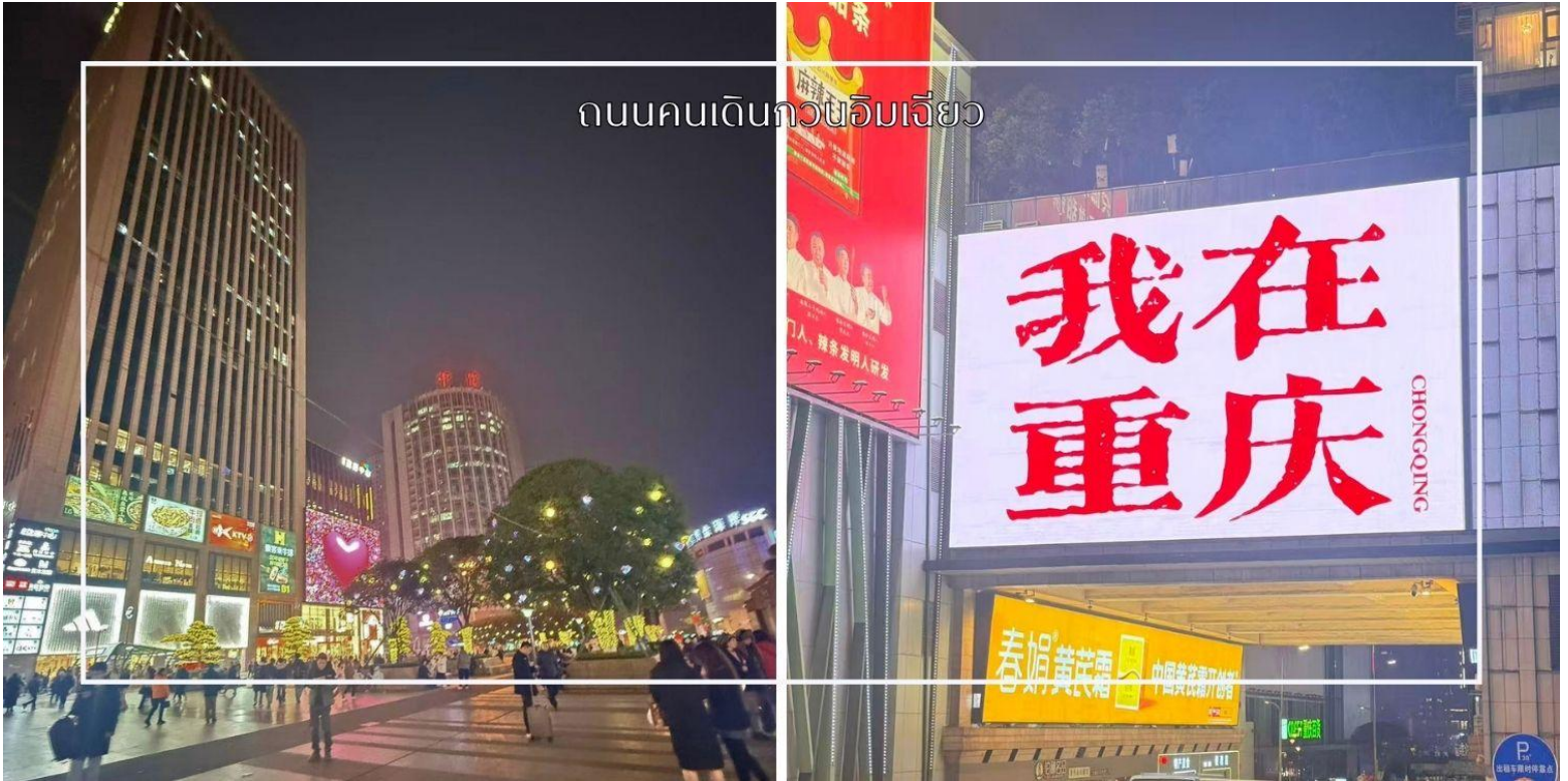
ถนนคนเดินกวนอิมเจียว

ซึ่งอย่างแท้จริง อีกหนึ่งไฮไลท์สำคัญคือจุดถ่ายภาพยอดนิยม ป้ายไฟ 我在重庆 (I am in Chongqing) ซึ่งถือเป็นแลนด์มาร์ก เช็คอินที่นักท่องเที่ยวไม่ควรพลาด