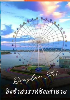
Qingdao Star ชิงช้าสวรรค์ชิงเต่าอาย