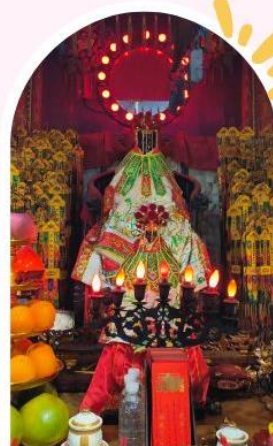
วัดเจ้าแม่กวนอิมฮ่องฮำ ขอพรเรื่องเงิน ทรัพย์สิน และความมั่งคั่ง