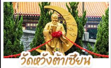
วัดเซว้งต้าเซียน