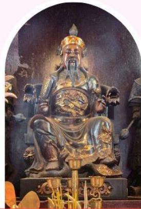
วัดปักโต เสริมโชคลาก นำพาความรุ่งเรือง