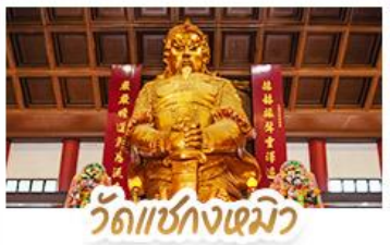
วัดแซงกงเมียว