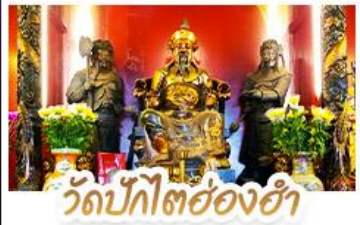
วัดปึกไค้อ่งฮ่า

นั่งกระเช้าองปิงสักการะพระใหญ่เทียนถาน • ฆอพรองค้แซง โขคลาก การเงินและธุรกิจ เทพเจ้าปึกไค้อ่งฮ่า ฆอพรเรื่องความสำเร็จในชีวิตและการงาน • วัดหวังต้าเซียน สักการะสิ่งศักดิ์สิทธิ์ เสริมมงคลชีวิต • ฆ่าแม่ทวนอิมอ้อ่งฮ่า ฆอเรื่องเงิน ทรัพย์สิน และความมั่งคั่ง • อิศระท่องเทียว 2 วัน เลือกซื้อบัตรคิสปี่แตนค้หรือซ้อปั้งจู่ใจ