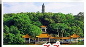
ภูเขาชิงชิว