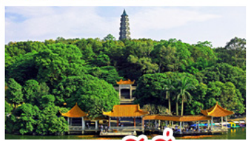
ภูเขาชิงชิว