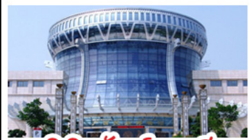
พิพิธภัณฑ์ทิวาสี

สวนสนุก FANTASYLAND - หมู่บ้านสไตล์ยุโรป พิพิธภัณฑ์ทิวาสี - ถนนคนเดินสามตรอกสองซอย ท่าเรือถึงใจ - ศาลเจ้าแม่กวนอิมพันกร เมนูพิเศษ อาหารกว้างตุง , สุกี้ซาบูหมาล่า