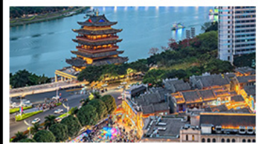
ถนนคนเดินสามตรอกสองซอย