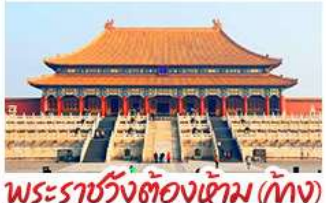
พระราชวังต้องห้าม (ปักกิ่ง)