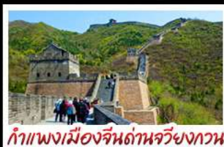
กำแพงเมืองจีนด้านจวิ้นกวน

UNIVERSAL STUDIO BEIJING DISNEYLAND SHANGHAI รถไฟความเร็วสูง - ถ่ายรูปห่อไข่มุก กำแพงเมืองจีนด้านจวิ้นกวน บ๊อพิศข เปิดปักกิ่ง, สุกี่หม้อไฟ BUFFET