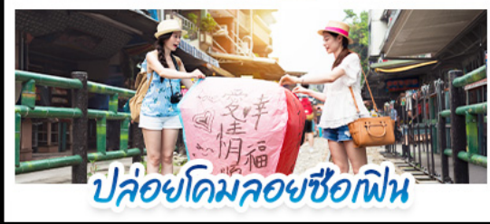
ปล่อยโดมลอยซื้อก๊อฟิน