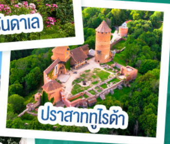
ปราสาทไครต้า