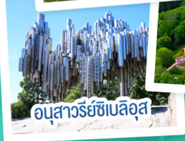
อนุสาวรีย์เซเบลึส