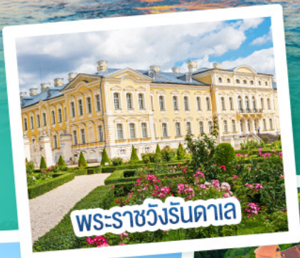
พระราชวังรินดาอ