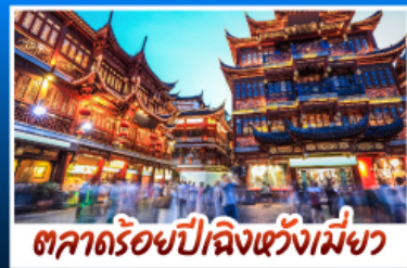
ตลาดร้อยปีเมืองเซี่ยงไฮ้