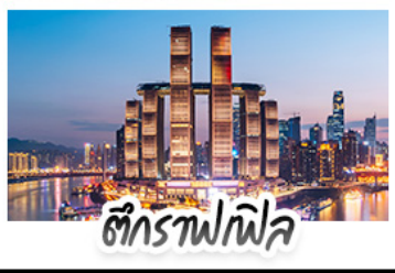
ตึกรางฟลิฟ