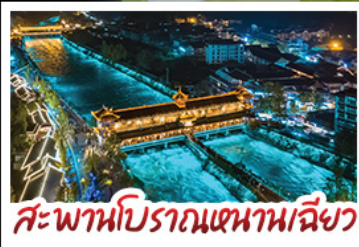
สะพานโบราณเขานางฟ้า