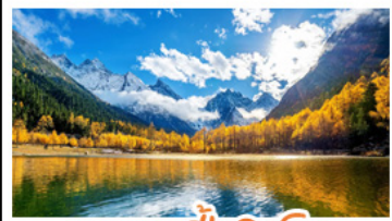
อุทยานป่าผึ้งโกว

จตุรัสหยางเทียนนู่ - หมู่บ้านด้านอนเซลฟี สะพานโบราณหนานเฉียว - อุทยานจิวจ้ายโกว อุทยานต่ำกุงิงชวน - อุทยานนี้ผิงโกว อุทยานภูเขาคีร์รุนนี - ซ้อปึงกนบนซุนซึลู่ ซ้อปึงกนบนโบราณชอยกว้างชอยแคบ แม่บูพิเศษ! สุกี้หืด สุกี้หมาล่าเสฉวน