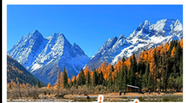
ภูเขาคีร์รุนนี