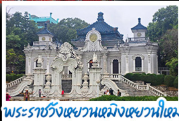
พระราชวังเซวณเหมิงเซวณใหม่