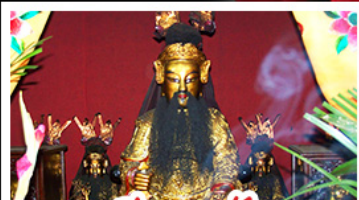
เอียงบูชัว