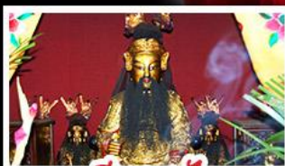
เอียงบูชิว