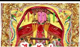
ไร่ตังมา

มรดกโลกบ้านดินถู่โหลว เตจิว - สะพานเซียงจิว ไร่ตังมา (เจ้าแม่กบกับทิม) - เอียงบูชิว (เจ้าพ่อเสือ) พระเจ้าตากสินมหาราช - อวนน้ำแร่จากธรรมชาติ ไม้ลงร้านซ้อป - พักโรงแรม 4 ดาว เมนูพิเศษ!!! อาหารแต้จิว 18 อย่าง, สุกี้ซีฟู้ด ห่านพะไลต้นตำรับแต้จิว