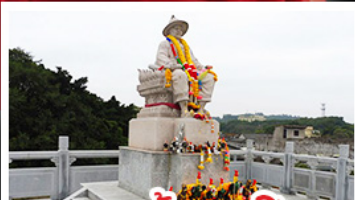
พระเจ้าตากสิน