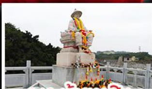
พระเจ้าตากสิน