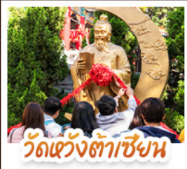
วัดเซ็งต้าเซียง