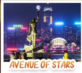
AVENUE OF STARS