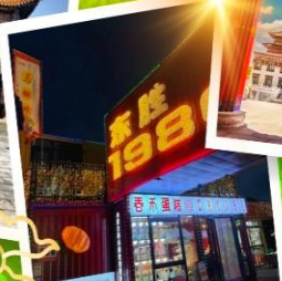
ถนนคนเดินคังบาร์ซี