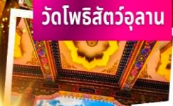
วัดโพธิสัตว์อูลาน