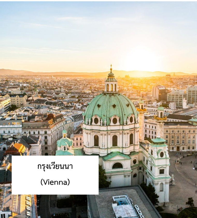
กรุงเวียนนา (Vienna)

เมนูพิเศษ!!! กุลาซซูป อาหารประจำชาติฮังการี