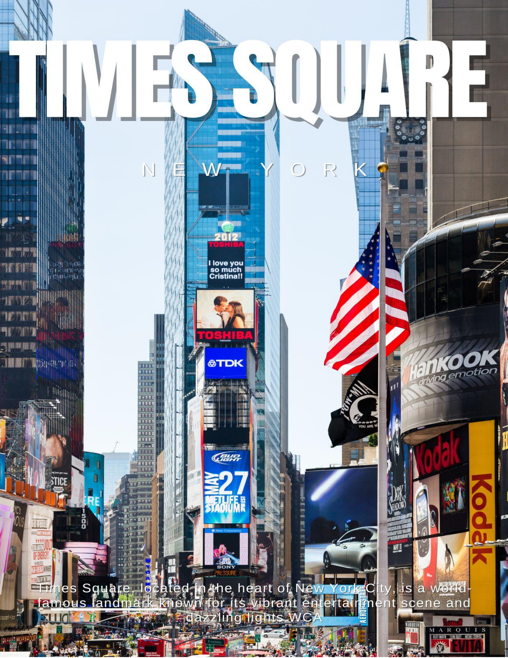
Times Square, located in the heart of New York City, is a world-famous landmark known for its vibrant entertainment scene and dazzling lights. WCA