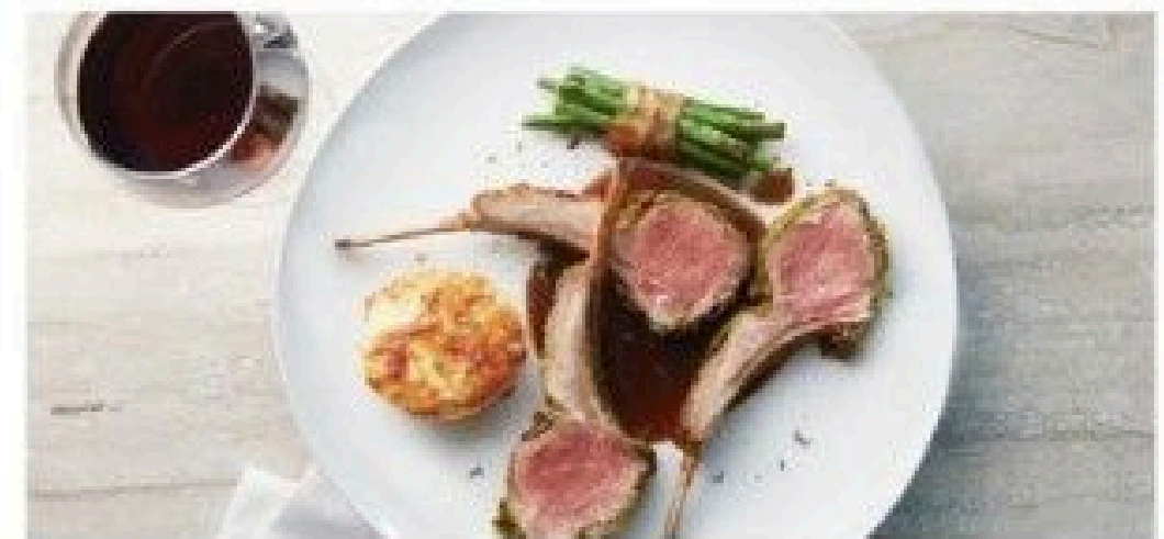
The Haven Restaurant