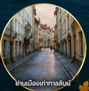
ย่านเมืองเก่าทาลลินน์