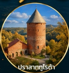
ปราสาทกูโรต้า