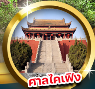
ศาลโคเฟิ่ง