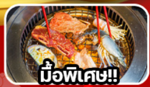
มือพิเศษ!!