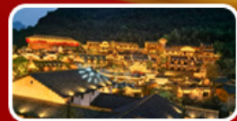
พักในหุบเขาเทวดา