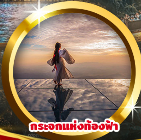
กระโจมแห่งท้องฟ้า